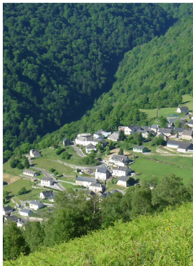
Le village de Bihères-en-Ossau.

1h30 3 706927 E - 4771190 N À gauche, prendre sur la route pour rejoindre la chapelle.