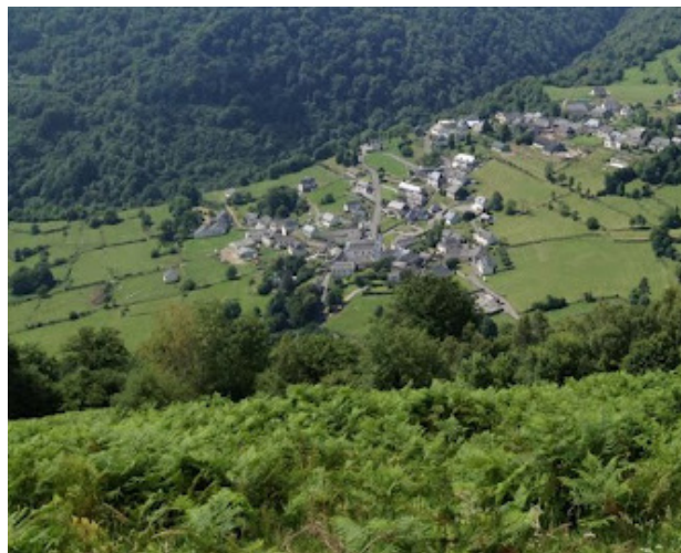
Le village de Bilhères-en-Ossau.

2h30 ⑧ 707123 E – 4770910 N Descendre, passer un portail et tourner à droite sur un chemin encadré de murets. Après une zone herbeuse ouverte, tourner à droite au niveau d'un portail au-dessus d'une grange. Suivre une piste empierrée. Traverser la D 294, puis une aire de parking et descendre la rue jusqu'au prochain carrefour. Prendre à gauche puis tout de suite à droite un sentier enherbé. À la croix, tourner à gauche pour rejoindre l'église.