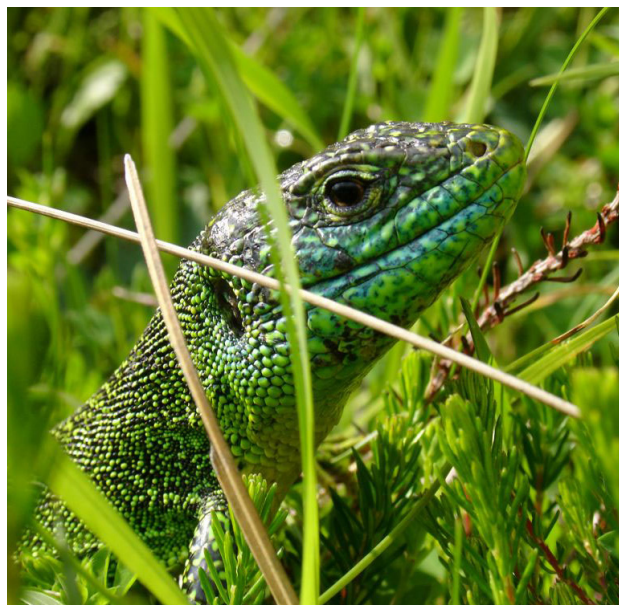
Le lézard vert vous accompagnera peut-être sur le chemin.

3 708859 E - 4766699 N À gauche, descendre sur la piste, la quitter 150m plus bas pour un joli sentier dallé qui coupe les lacets (les jours humides, éviter ce passage très glissant et continuer sur la piste). De nouveau sur la piste, continuer à descendre jusqu'au village et au point de départ.