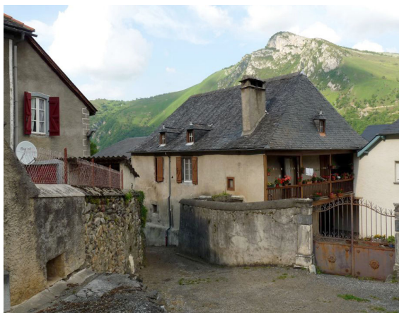
Maison du village de Gère.

1h00 2 708747 E - 4766773 N À gauche, descendre dans un bois de noisetiers. Le sentier rejoint une piste pastorale.