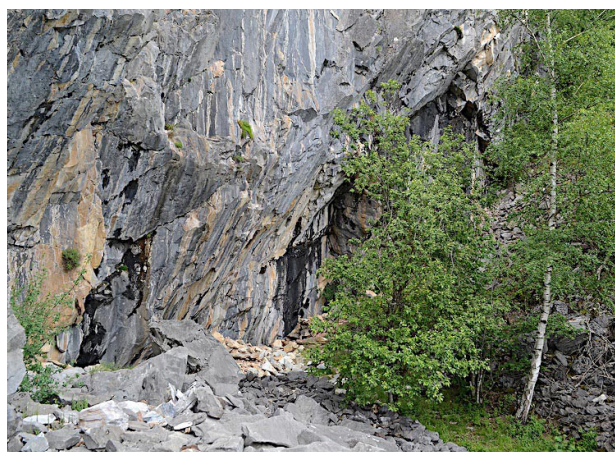
Carrière de marbre blanc

1h05 4 711231 E - 4763842 N Descendre la piste bétonnée jusqu'au point 1 . Là, tourner à gauche vers le village en passant devant un très joli lavoir. La rue s'ouvre sur la place de la mairie puis en contrebas sur le parking de départ.