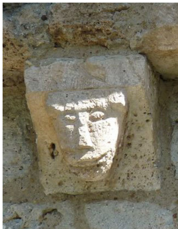
Détail de l'église d'Assouste du XII e siècle.

1h45 5 710794 E - 4762818 N Au niveau d'une grosse maison à galerie, prendre à gauche un sentier entre des murets qui descend à travers champs. Jolie vue sur Béost. Au bout de 100m, suivre à droite un chemin plus large qui rejoint le centre de Béost.