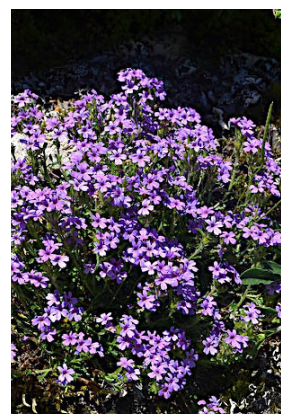
Érine des Alpes

8 706383E - 4769238 N Poursuivre à droite en contrebas par un chemin raide qui descend à travers la forêt et rattrape la piste qui rejoint la route et la chapelle.