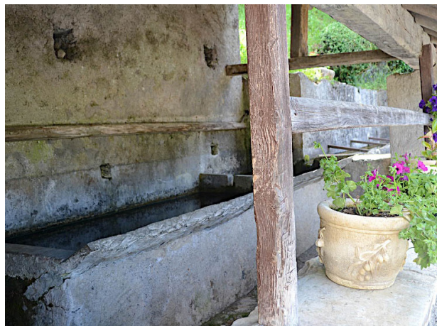
Lavoire à Bagès.

4 713762 E - 4762035 N Tourner à gauche pour suivre la piste pastorale et continuer toujours en descente. Quelques lacets plus bas, on retrouve le bitume. Peu après la première épingle à droite, quitter la route pour prendre à gauche un bon sentier en sous-bois.