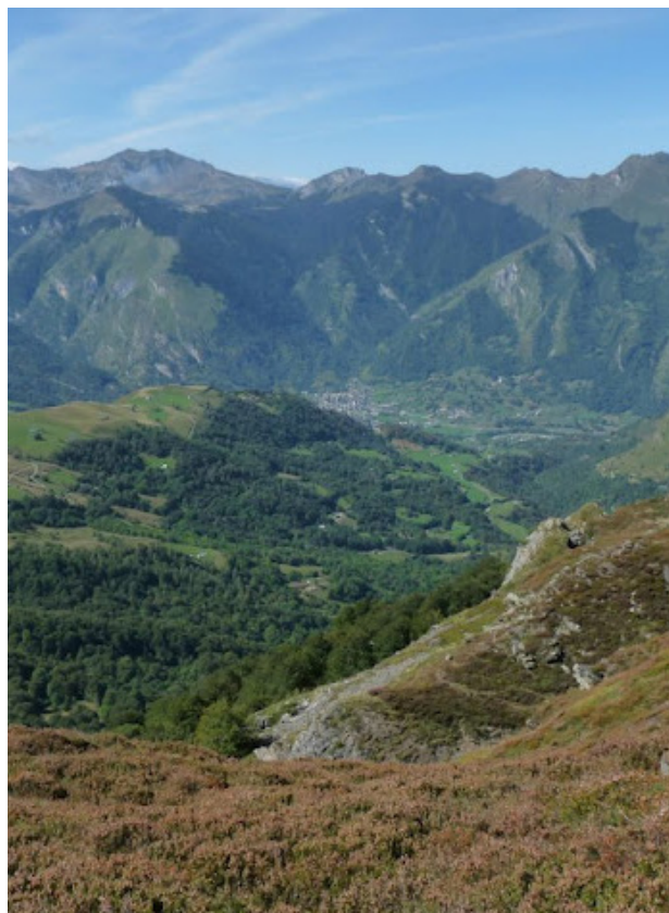
En arrière-plan, le village de Laruns.

2h30 5 716539 E - 4762675 N À droite, prendre un chemin qui traverse puis descend sur le Col d'Aubisque.