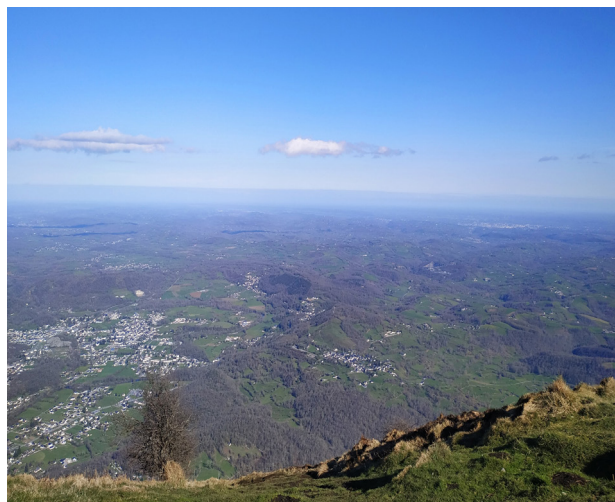
Vue sur la plaine depuis le sommet

4h15 6 710919E – 4772077N Au croisement, tourner à droite, vers le nord. Franchir le portillon (veiller à ce qu'il reste bien fermé) et s'engager sur un très joli sentier en sous-bois. Il rejoint un chemin en gravier débouchant à proximité du point 1 . Il ne reste plus qu'à descendre côté gauche le chemin bordé de murets emprunté à l'aller qui mène au centre du bourg de Louvie-Juzon.