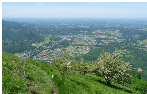
Vue panoramique sur la vallée, Arudy et le piémont.

4h00 12 714645 E - 4772477 N La piste remonte légèrement en entrant dans la forêt. Au croisement avec une grosse piste empierrée, prendre à droite et la suivre jusqu'au parking.