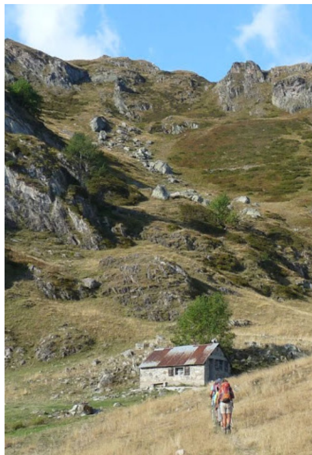
Cabane de Chérue.