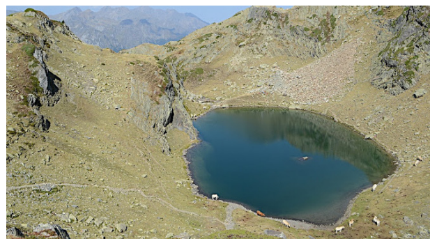
Lac du Lurien.

6 715485 E - 4749279 N Lac du Lurien. Le retour s'effectue par le même itinéraire que la montée.