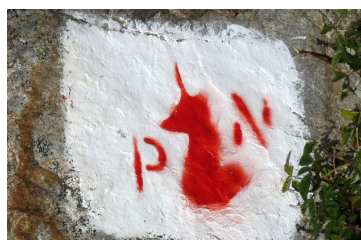
Symbole de limite du parc national.