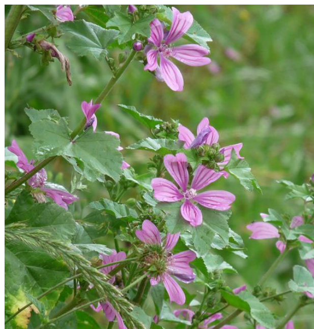
Mauves sur les bords du chemin.

gauche. Passer la ferme Mirassou et juste devant prendre à gauche un chemin dans les fougères. Passer la ferme Brouca et continuer chemin Lannezeque qui descend puis remonte. À droite, suivre le Chemin de Larret. Continuer sur la petite route jusqu'au village de Buzy. Prendre à droite puis tout de suite à gauche en traversant la D920 pour rejoindre le parking.