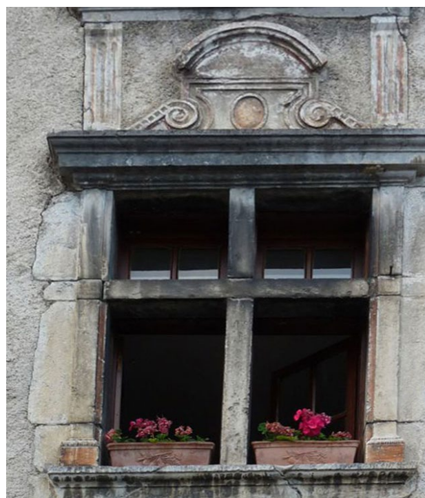
Fenêtre à meneaux du XVII e à Bielle.

quitter la route et s'engager à droite sur un sentier herbeux. Il mène à la croix de Bilhères (point 2 ). Redescendre sur Bielle par le chemin emprunté à la montée.