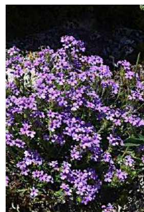
Érine des Alpes

8 706383 E - 4769238 N Pour suivre à droite en contrebas par un chemin raide qui descend à travers la forêt et rattrape la piste qui rejoint la route et la chapelle.