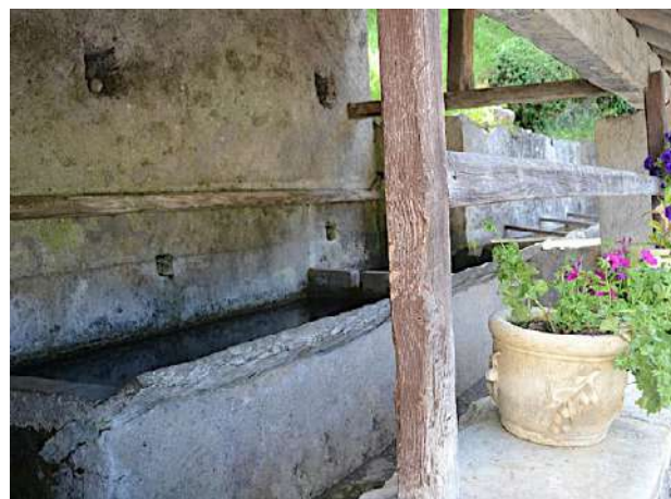
Lavoir à Bagès.

4 713762 E - 4762035 N Tourner à gauche pour suivre la piste pastorale et continuer toujours en descente. Quelques lacets plus bas, on retrouve le bitume. Peu après la première épingle à droite, quitter la route pour prendre à gauche un bon sentier en sous-bois.