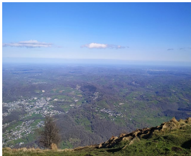
Vue sur la plaine depuis le sommet

6 710919 E – 4772077 N Au croisement, tourner à droite, vers le nord. Franchir le portillon (veiller à ce qu'il reste bien fermé) et s'engager sur un très joli sentier en sous-bois. Il rejoint un chemin en gravier débouchant à proximité du point 1 . Il ne reste plus qu'à descendre côté gauche le chemin bordé de murets emprunté à l'aller qui mène au centre du bourg de Louvie-Juzon.