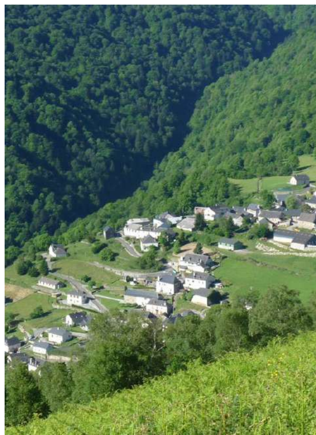
Le village de Bihères-en-Ossau.

1h30 3 706927 E - 4771190 N À gauche, prendre sur la route pour rejoindre la chapelle.