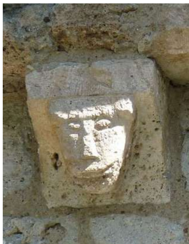
Détail de l'église d'Assouste du XII e siècle.

1h45 5 710794 E - 4762818 N Au niveau d'une grosse maison à galerie, prendre à gauche un sentier entre des murets qui descend à travers champs. Jolie vue sur Béost. Au bout de 100m, suivre à droite un chemin plus large qui rejoint le centre de Béost.