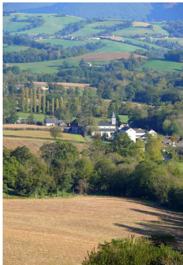
Lys depuis la route de Sévignacq-Meyracq.

1h15 4 715361 E - 4779584 N Descendre à gauche. Traverser la D 287 et continuer à descendre en direction du village.