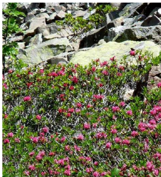
Rhododendrons dans les éboulis.

3h30 4 704088 E – 4756319 N Reprendre le même chemin pour la descente.