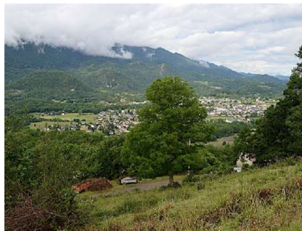
Vue sur Arudy.

1h40 8 710721 E - 4776143 N. Prendre à droite pour revenir sur Sévignacq.