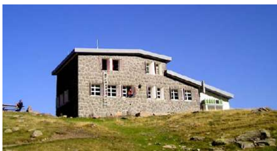
Refuge de Pombie.

1h30 ③ 710292 E - 4745762 N Du refuge, revenir par le même chemin.